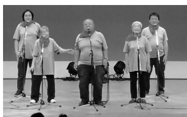
(ワークショップ西風舎)

3番手の「放課後等デイサービスきちの実」は皆で力を合わせて踊り切りました。4番手は