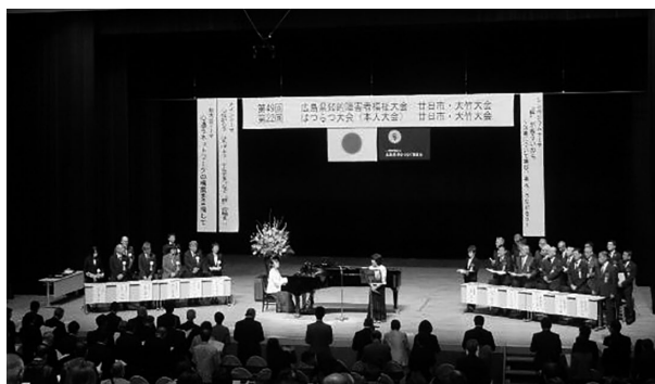
一般大会 開会行事 さといもの会の歌と伴奏による「手をつなぐ母の歌」の斉唱

廿日市市手をつなぐ育成会、おおの手をつなぐ育成会、大竹市手をつなぐ育成会の合同で主管された令和6年度第49回広島県知的障害者福祉大会廿日市・大竹大会並びに第22回はつらつ大会（本人大会）廿日市・大竹大会が、総勢687名の参加者により盛大に開催いたしました。久しぶりの一日開催でした。