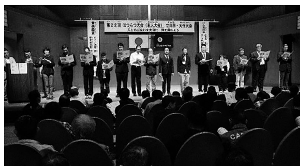
はつらつ大会（本人大会）閉会式での「大会決議文（案）」の発表

本大会のメインテーマは、「つながろう ひろげよう 手と手をつなぐ“絆”の輪を！！」です。一般大会のテーマは、「心通うネットワークの構築を目指して」、はつらつ大会は、「人との出会いを大切に 絆を深めよう」です。人間関係が希薄化する中、障害の有無にかかわらず地域で安全に安心して暮らすことができる共生社会の実現のためには、相手を理解し寄り添える絆の輪の広がりが必要です。